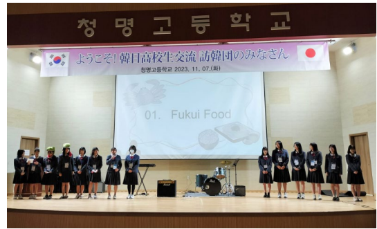
2023년 11월 7일 【학교방문·교류】 청명고등학교(제2단)