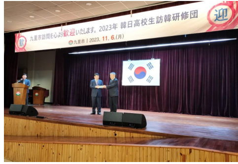
2023년 11월 6일 【예방】 경기도 구리시청