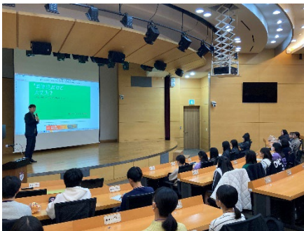
2023년 11월 9일 【교류】 방한단 OB와의 대화