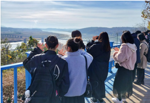
2023년 11월 8일 【시찰】 비무장지대(DMZ) 캠프 그리브스