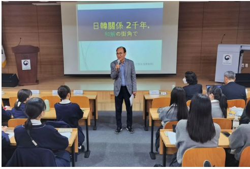
2023년 11월 6일 【강의】 한일관계 2000년 화해의 길에서