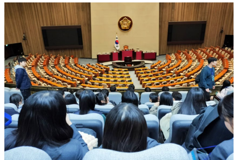
2023년 11월 10일 【시찰】 국회의사당