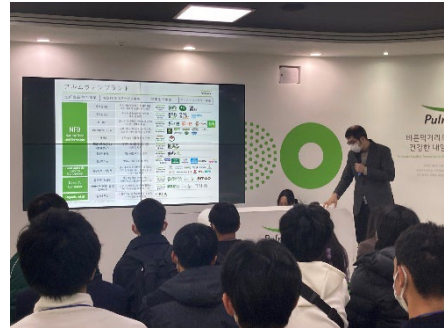
2023년 11월 9일 【기업 방문】 플무원