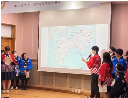
2023년 11월 7일 【학교방문·교류】 성남외국어고등학교(제1단)